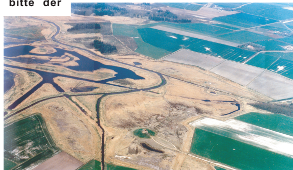
Blick auf das Wandergebiet mit dem Infopavillon (Mitte unten) und der Kophallig im Hintergrund (links oben)